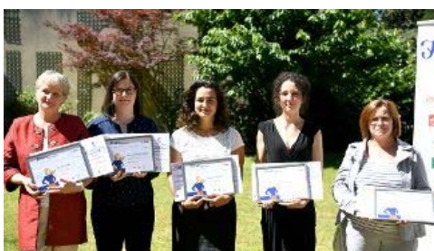
Les cinq lauréates du Prix Fémin'Initiatives 2018.

CHARTRES ECONOMIE EMPLOI INNOVATION SERVICES