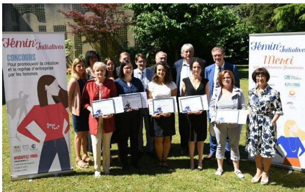
Les partenaires réunis autour des cinq lauréates du concours 2016.

Depuis seize ans, la préfecture et les chambres consulaires d'Eure-et-Loir fêtent les initiatives entrepreneuriales des femmes du département. Leur courage et leur détermination sont reconnus.